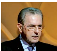
M. Jacques Rogge Président du CIO

Pour conclure, il a rappelé les efforts entrepris au niveau national, notamment par le biais du Titre IX, une loi historique adoptée en 1972, qui a donné aux jeunes femmes le droit de participer aux activités sportives des établissements d'enseignement secondaire et supérieur. À l'occasion du 40 e anniversaire de cette loi capitale, il a souhaité que l'on continue d'œuvrer en faveur d'une représentation croissante des femmes dans les instances dirigeantes du sport et les compétitions sportives.