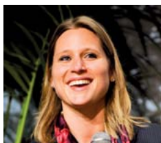
M me Angela Ruggiero Membre du CIO, olympienne, membre de la commission des athlètes du CIO

La séance a été animée par M me Angela Ruggiero, membre du CIO représentant les États-Unis et nouvelle présidente élue de la Fondation du sport féminin.