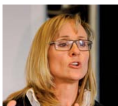
M me Nancy Hogshead-Makar Olympienne et experte du TITRE IX

Un autre programme, intitulé « Good Governance », a été lancé l'an dernier en collaboration avec les fédérations nationales. Ce programme énonce dix principes auxquels toutes les fédérations doivent adhérer. Les comités exécutifs des fédérations nationales sont notamment chargés de débattre et de mettre en œuvre des stratégies et des politiques sur une base permanente. L'une de ces politiques porte sur l'engagement ferme des fédérations quant à la manière de parvenir à la parité.