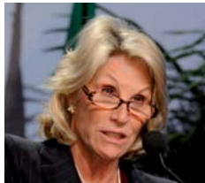
M me Donna De Varona Membre de la commission femme et sport du CIO

La groupe de discussion était animé par M me Donna De Varona, membre de la commission femme et sport du CIO.