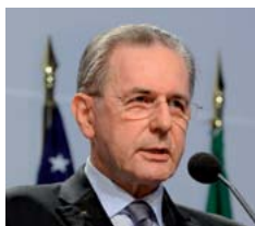
M. Jacques Rogge Président du CIO

En dépit des progrès réalisés en matière de participation des athlètes féminines aux Jeux Olympiques, il reste un travail considérable à abattre pour que davantage de femmes accèdent aux postes administratifs et d'encadrement au sein du Mouvement olympique, ont déclaré les intervenants lors du discours inaugural de la 5 e Conférence mondiale du CIO sur la femme et le sport.