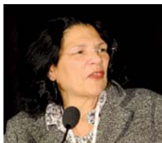
M me Anita L. DeFrantz Présidente de la commission femme et sport du CIO

La cérémonie d'ouverture a été présidée par M me Anita L. DeFrantz, présidente de la commission femme et sport du CIO.