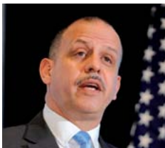
S.A.R. le prince Feisal Al Hussein Membre du CIO, fondateur et président de « Generations for Peace »