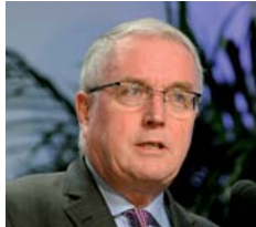
M. Pat McQuaid Membre du CIO, président de l'UCI