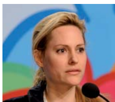
M me Aimee Mullins Paralympienne et ancienne présidente de la Fondation du Sport Féminin