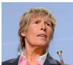
M me Diana Nyad Ecrivain, journaliste et nageuse de fond

Les intervenantes étaient M me Geena Davis, actrice récompensée aux Oscars et fondatrice du Geena Davis Institute on Gender in Media, et M me Diana Nyad, championne du monde de natation et journaliste.