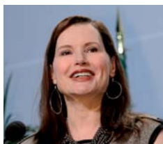
M me Geena Davis Actrice récompensée aux Oscars et défenseur de l'autonomisation des femmes