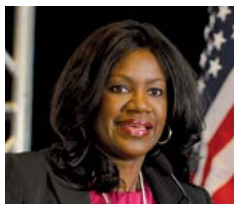
M me Benita Fitzgerald-Mosley Championne olympique, présidente de la Fondation du sport féminin