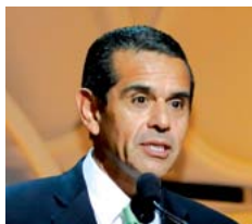
M. Antonio Villaraigosa Maire de la ville de Los Angeles

Pour conclure, elle a demandé aux participants de mettre l'accent lors des deux journées de débat sur les moyens à mettre en œuvre pour rendre le monde du sport plus accessible aux femmes.