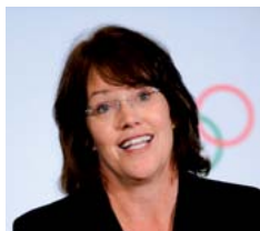
M me Christine Brennan Journaliste olympique, chroniqueuse sportive pour USA Today, commentatrice pour ABC News, Radio publique nationale et CNN

Concernant le Comité International Olympique, a déclaré M me Brennan, il doit inciter les comités nationaux à avancer sur la question de la discrimination envers les femmes avec autant de fermeté que lorsqu'il pousse les pays hôtes à respecter les délais de construction, par exemple.